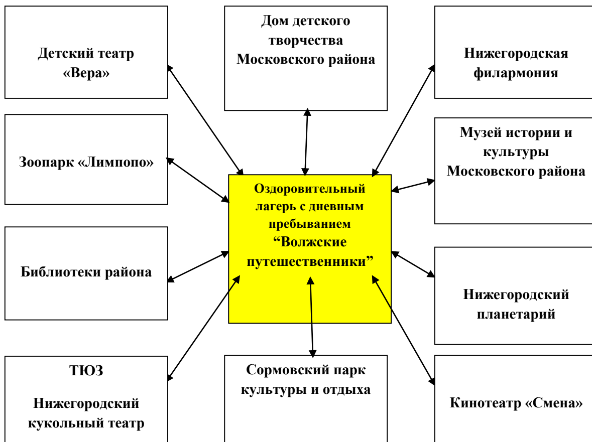
СХЕМА ВЗАИМОДЕЙСТВИЯ С СОЦИАЛЬНЫМИ ПАРТНЁРАМИ